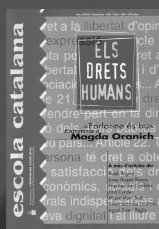
Escola catalana Núm. 354 Novembre 1998