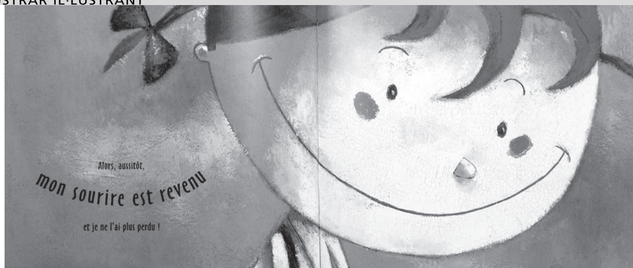
IL·LUSTRACIONS: MATILDE PORTALÉS